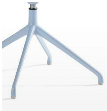
Base en aluminium / KB Peint, chromé ou gloss.