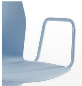
Accoudoirs fermés / KB Peint, chromé ou gloss.