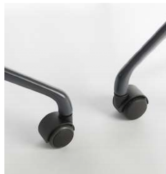
Roulettes / KB Dures ou souples.